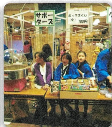
志津まつりゲームコーナー