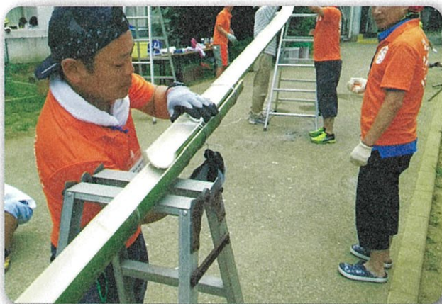
夏キャンプでのサポート