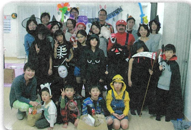
ハロウィンパーティーの1コマ