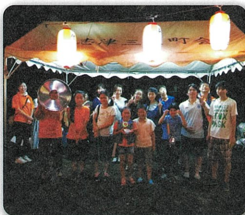
上志津3区 夏祭り 出店