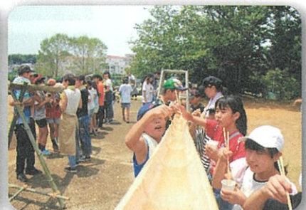
夏はやっぱり流しそうめん