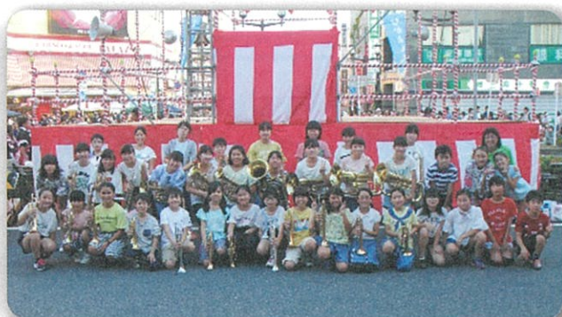
志津中吹奏楽部、上小金管部の皆さん、毎年素敵な演奏ありがとうございます。