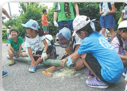
みんな自分でうつつわを制作