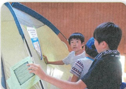
今年度初、体育館からの脱出ゲーム