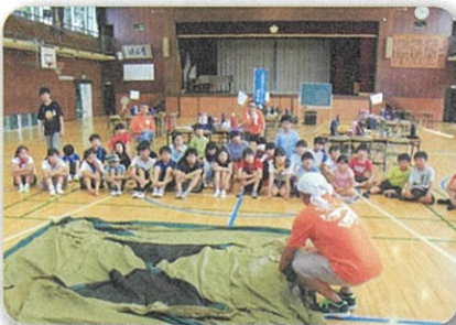
テント設営のレクチャ

ただ、この日は猛暑であり、子どもたち、お手伝いの方々にとっても、大変なキャンプでしたが、いい経験となりました。