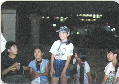
夜は「なりたい自分」の発表