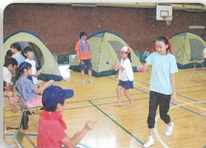
食材争奪のスプーンリレーゲーム