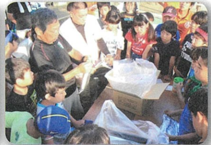
朝食のアルファ米の作り方説明