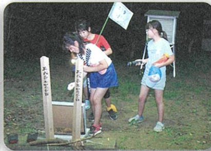
体育館へ戻る途中の肝試し