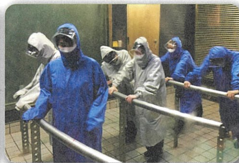
暴風雨体験、想像以上の風にビックリ