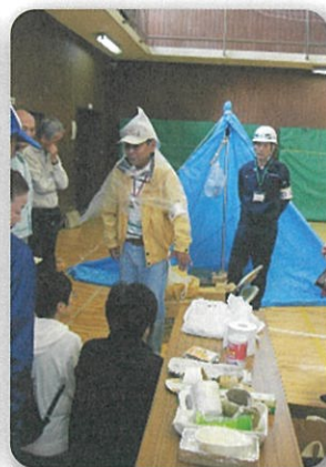
防災用品展示・実演