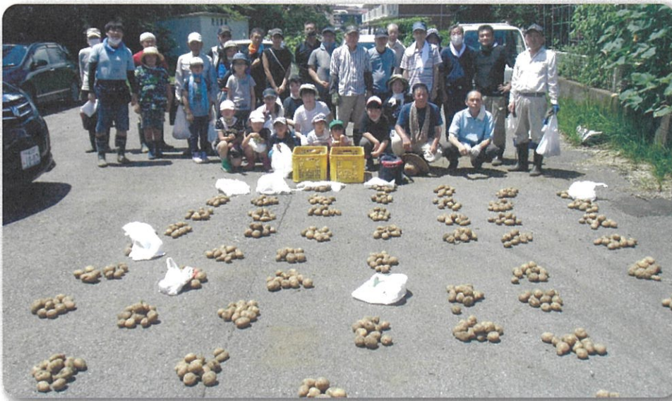
最後に掘ったじゃがいもと一緒に集合写真