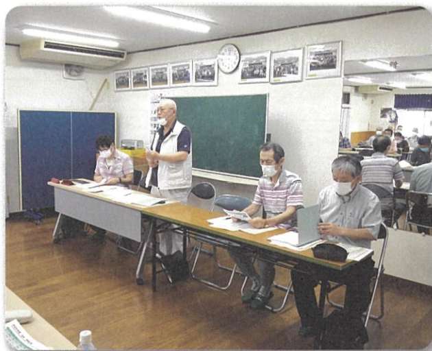
第一回理事会 上志津会館にて

最後にはこのコロナ禍中、医療現場で働く方の貴重な体験談を聞かせていただきました。