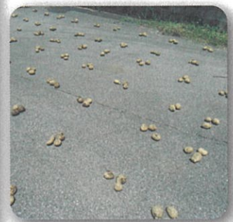
取れたてのじゃがいもも、ディスタンスしました