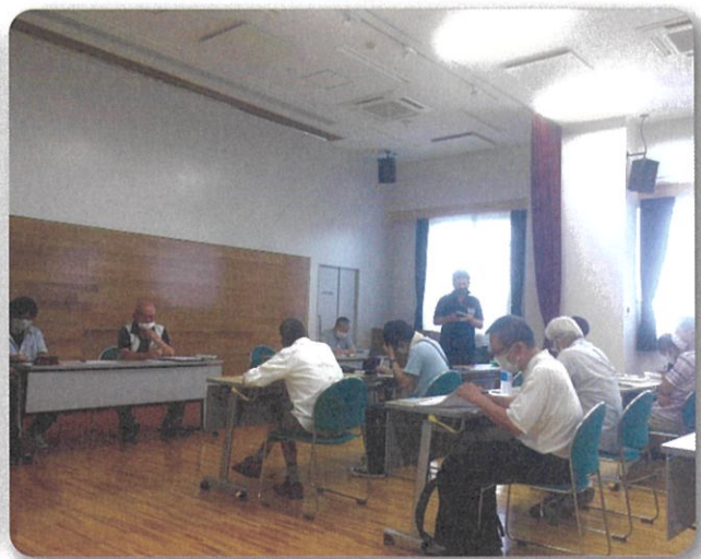
第二回理事会 志津プラザにて