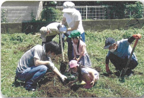
じゃがいもあるかな？

7月26日（日）上志津小学校隣に今年開墾したばかりの畑で、初収穫となるじゃがいも掘りを行いました。この日収穫したのは、今年の3月に植えた男爵いもです。降雨のため当初予定を3時間遅らせて開催となりましたが、直射日光が厳しい中、周辺住民の約40人が参加し汗を流しながら一生懸命収穫をしました。NHKなどの報道によりますと、今年は「天候不順の影響で、じゃがいもとにんじんの卸売価格が平年の2倍以上となるなど、一部の野菜が高値となっています。」と報じられています。そんな中、上志津小学校畑のじゃがいもは、「そこそこの出来映えで、初収穫の割には良いのでは」と声が上がっていました。例年ですと、その後に収穫祭を行って皆で収穫の喜びを分かち合いますが、今年は新型コロナウイルス感染拡大の影響により中止に。各自持ち帰り、家庭料理で春植えじゃがいもの味覚を堪能しました。