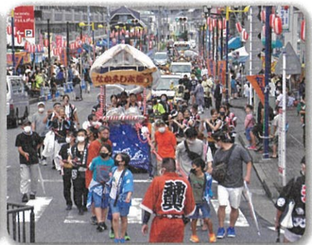
あいにくの雨天の中、なかよし太鼓の山車を先頭に御輿が続きます。