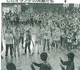
日本の振り付けダンスに挑戦したオランダの児童たち

News/ミニニュース 内ホムステイ先に滞在の日、上志津小の高学年児童の教室に集まり、親子作りの和太鼓演奏や日本のオランダの児童たちは、文化を満喫した。 全校児童が出迎えた交流とダンスを披露、四国では、オランダの児童が、の児童が一緒にダンスに興り、授業や休み時間を使って創る場面も見られ交流会は盛り上がった。