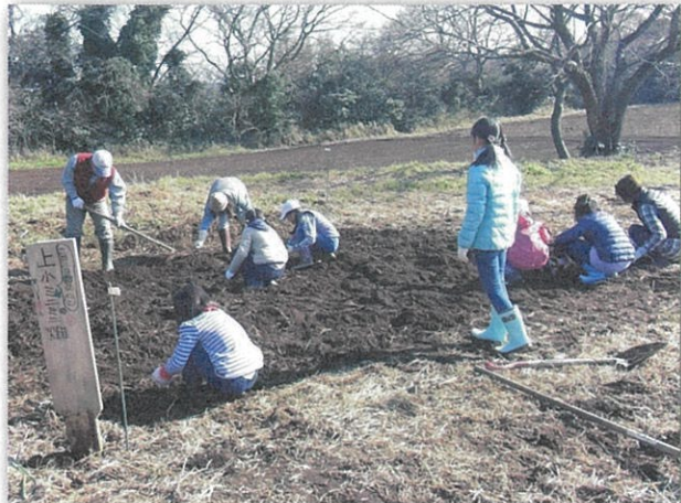
今は、キャベツに挑戦中