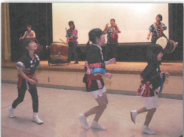
最後になかよし太鼓のねふた