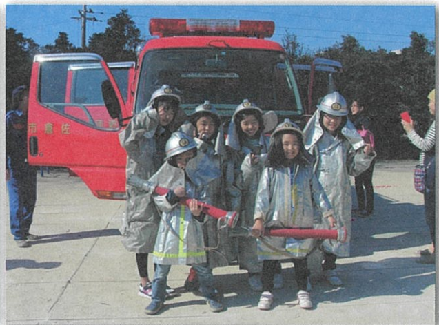
消防車は、子ども達に人気です