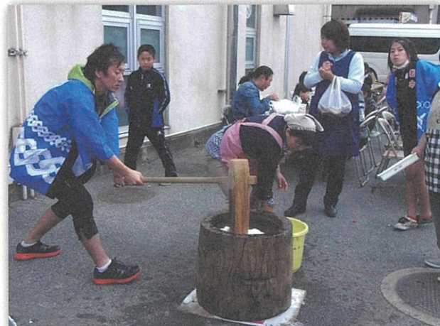
先生も餅つきで大活躍