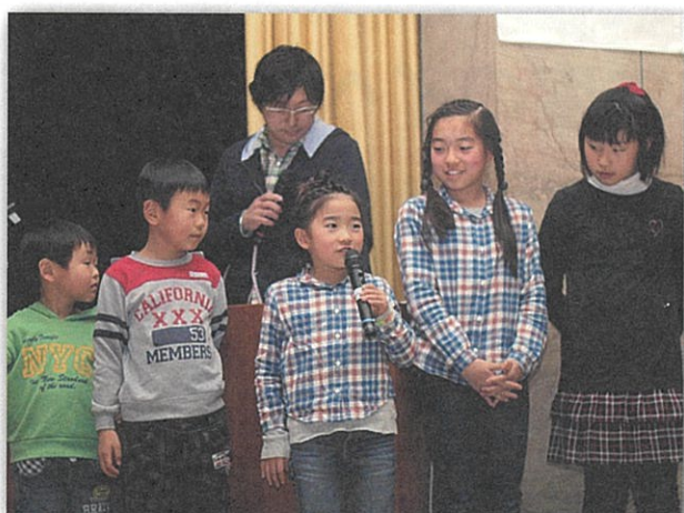
イベント参加の感想を子どもたちが発表