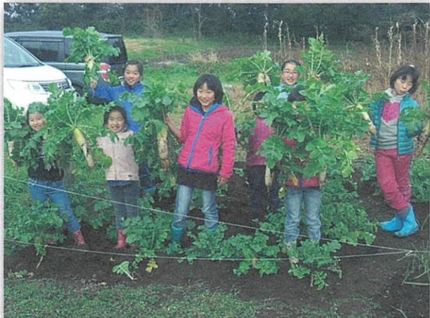
種からこんなに大きくなるものです

きっかけは、まち協のじゃがいも収穫ですが、今では畑にすっかりはまっているようです。