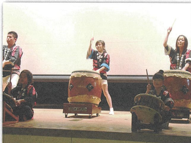
発表中になかよし太鼓の実演も