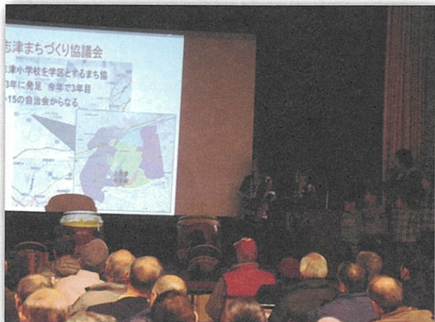
スライドを利用した発表

2月7日（日）佐倉中央公民館で、「まちづくりフォーラム」が開催されました。これは、佐倉市内のまちづくり協議会が一堂に会し、事業報告を行うものです。上志津まち協も趣向を凝らして、発表してきました。