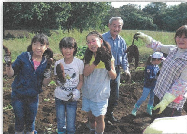
蕪木会長も一安心