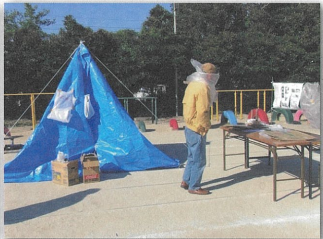
今回の初ブース「防災用品展示・実演」