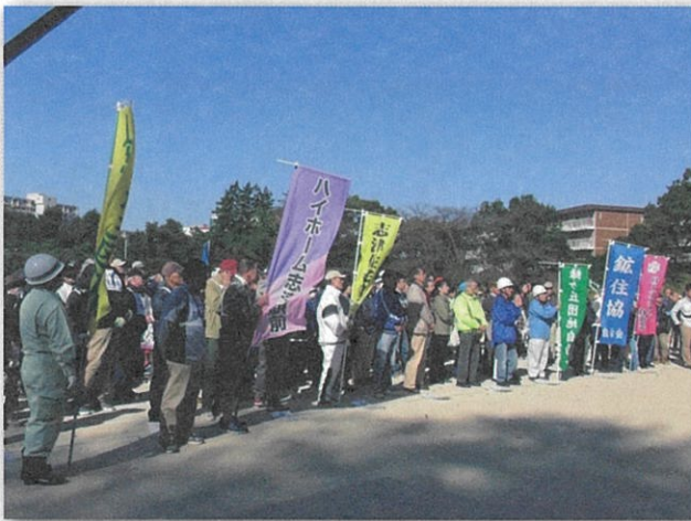
15の自治会が集まりました