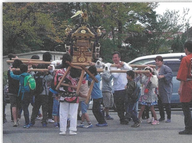
上志津二区自治会からおみこしも